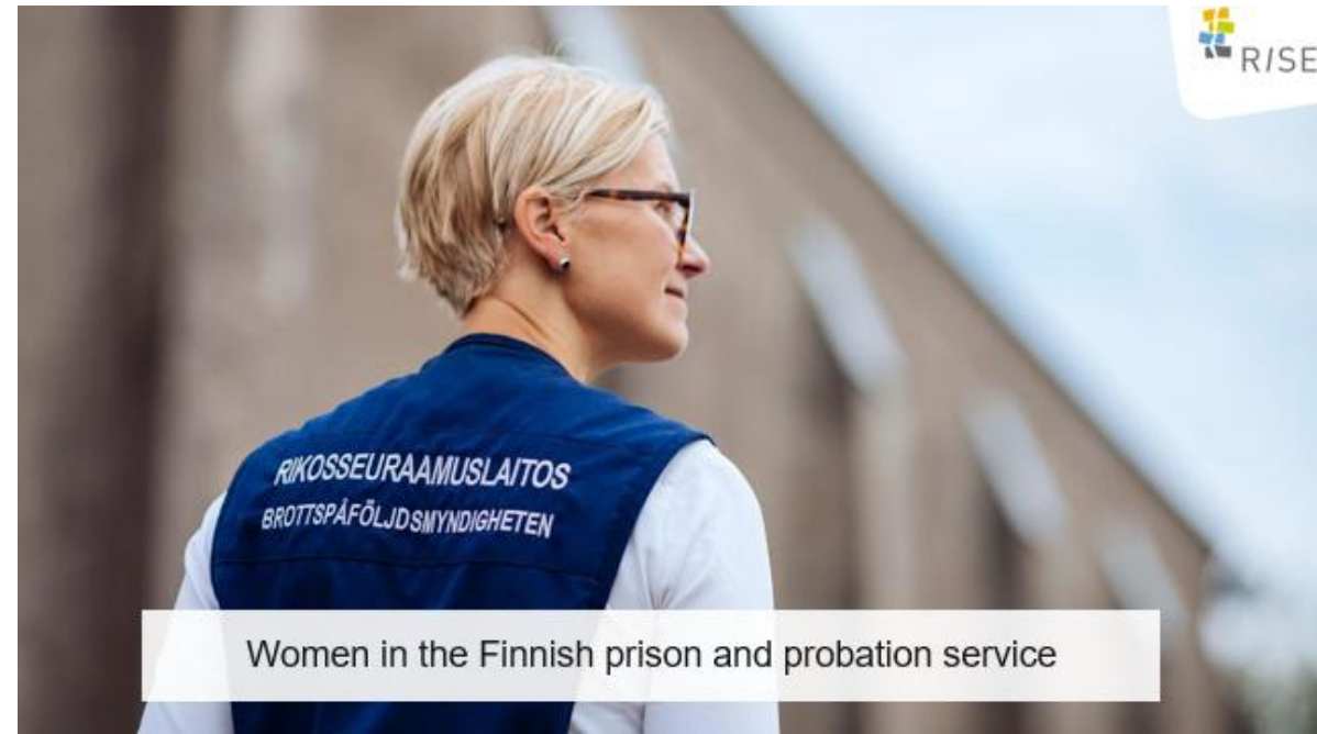
Women in the Finnish prison and probation service